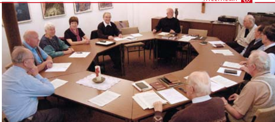
Lebenslanges Lernen und Teilhabe: Die Brüder aus Werne mit Mitgliedern des Weltlichen Zweiges während einer Weiterbildung