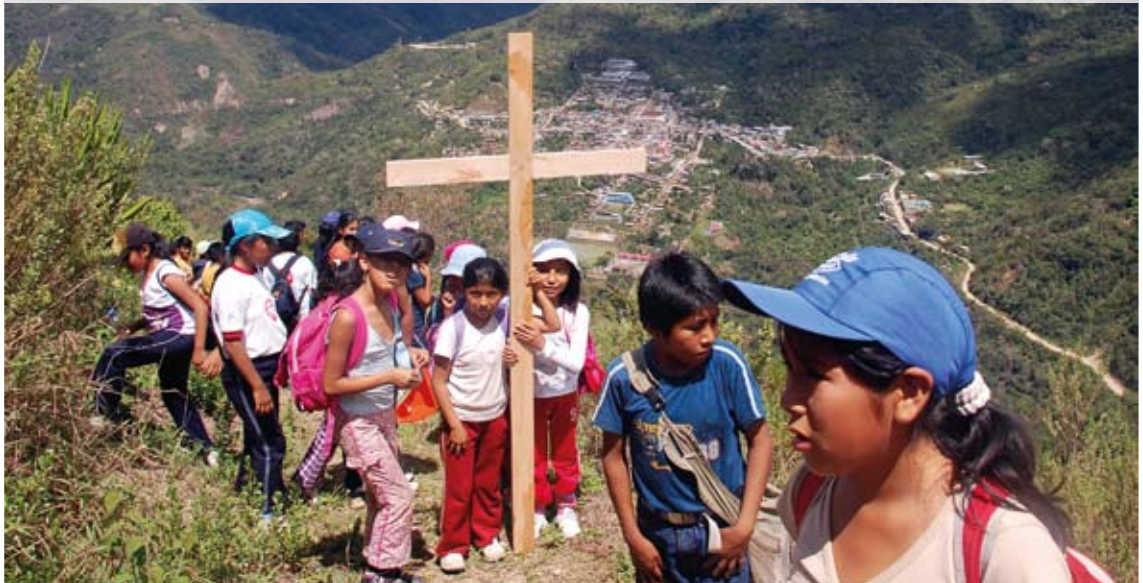
Die Kommunionkinder aus San Juan del Oro vor der atemberaubenden Andenkulisse, die erahnen lässt, in welchen Weiten und Höhen die Menschen leben

50 Jahre Gemeinde San Juan del Oro in Peru