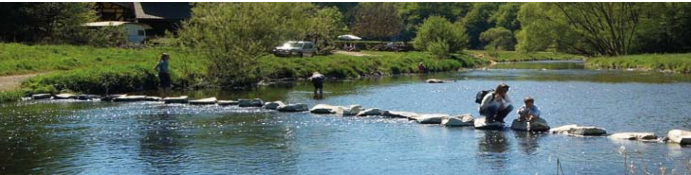
Natur erleben mit Kindern an der Nister

Ein Spaziergang mit Kindern in die Natur ist immer ein Abenteuer. Was stellen sie nicht alles an! Sie klettern halsbrecherisch auf einen Felsen oder liegen eine Stunde lang auf dem Bauch an einem Teich und versuchen Frösche oder Kaulquappen zu fangen. Sie streicheln alles was ein Fell hat und füttern, was Schnabel oder Maul auf-sperren kann. Ihre Hosentaschen sind reine biologische Studien-sammlungen: Federn, Tannenzapfen, Muscheln, Blüten, ja sogar ein lebender Minikrebs oder ein verängstigter Frosch.