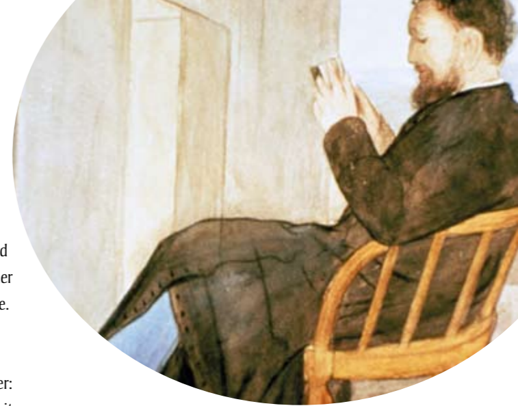
Studie des englischen Malers Edward Clifford, der P. Damian auf Molokai besuchte

tekt, Zimmermann und Maurer, Erfinder, Organisator, Lehrer, Pfarrer, Polizist und Notarzt – er half einer Frau bei der Geburt ihres Kindes. 36 Handwerke – und mehr. Doch viel Licht erzeugt auch manchen Schatten. Sein späterer Gehilfe und treuer Freund Joseph Dutton musste bei aller Bewunderung sagen, dass der gute Pater hundert Sachen anfangte, aber nicht zu Ende führte.