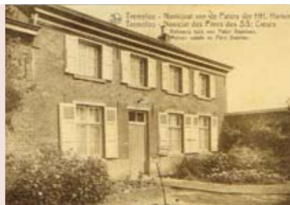
P. Damians Geburtshaus in Belgien