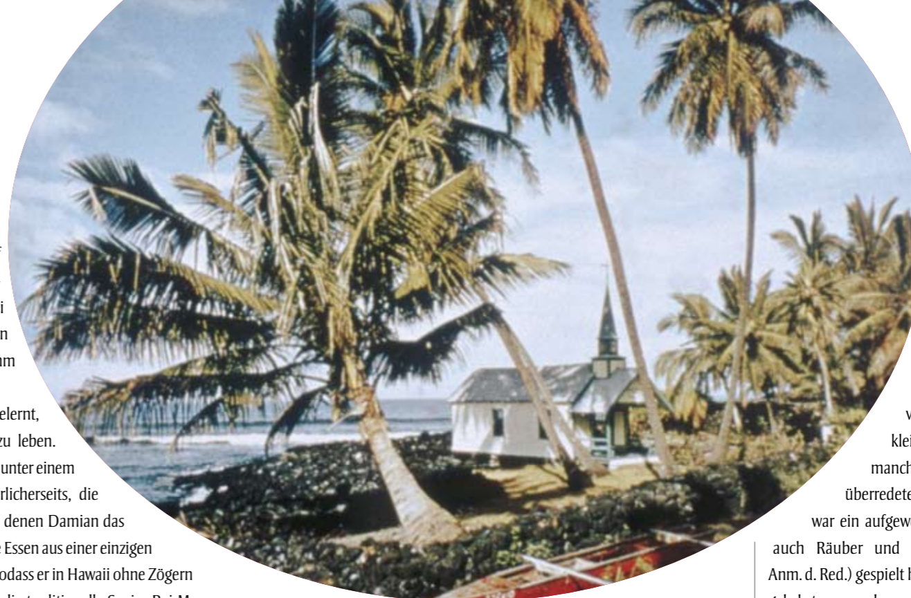
Kirche auf Molokai, von P. Damian und den Aussätzigen gebaut

P. Damian als junger Missionar: Vor ihm lag ein schweres und außergewöhnliches Leben. Er selbst bezeichnete sich aber stets als glücklichen Menschen.