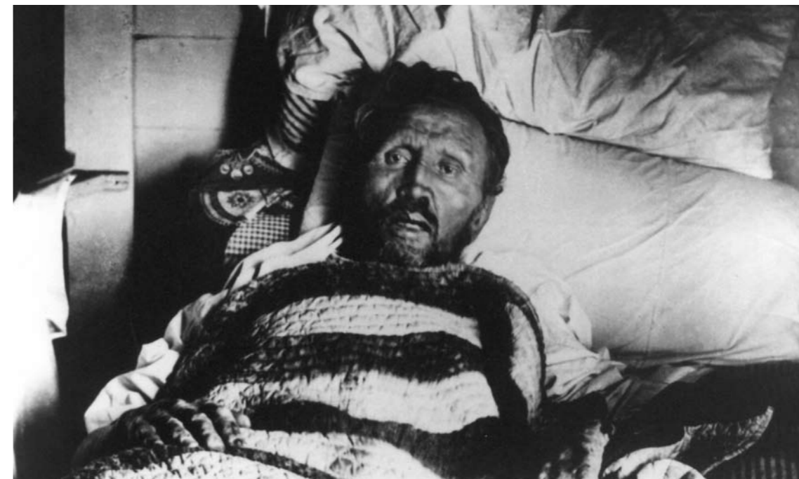
P. Damian kurz vor seinem Tod. Er stirbt glücklich und mit der Gewissheit, seinem Herrn bis zum Ende gedient zu haben.

Wenn man nach einer Formel sucht, die den Heiligen und seine Anziehungskraft, das Geheimnis seiner Faszination erklären kann, so ist es vielleicht dieses: Er verstand es, die Wirklichkeit hinter der Oberfläche sichtbar zu machen, das Leichte im Schweren. Wenn er eine Wunde verband, so tat er es nicht nur, um den Eiter zu stoppen, sondern um den Kranken froh zu machen, sei es auch nur für kurze Zeit. Wenn er einen Sarg zimmerte, so um dem Toten eine letzte Ehre zu erweisen. Wenn er aus einer alten Blechdose eine Flöte fertigte, so um Musik zu machen, die das Herz erfreut. Wenn er Ge-